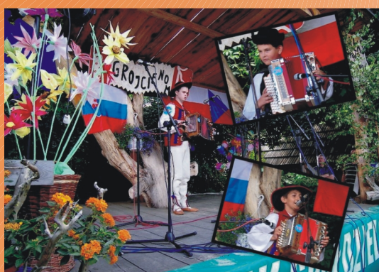
"Międzynarodowy Konkurs Heligonistów"