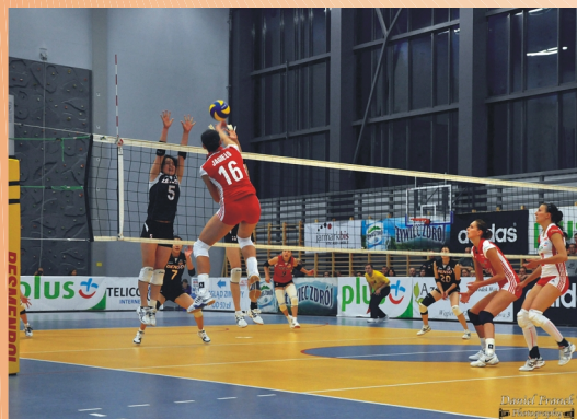
"Mecz Piłki Siatkowej Kobiet Polska - Japonia"