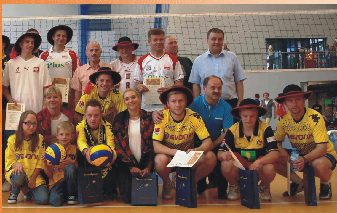
"Mecz Charytatywny Gwiazd Polskiego Sportu"